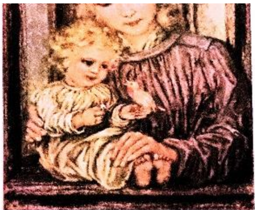
M. Spöhl eccl. appz. VMS 278

O kon ik als een vogeltje Gods lof in klanken leggen Om zo m'n hulde, dank en trouw en helde uit te zeggen.